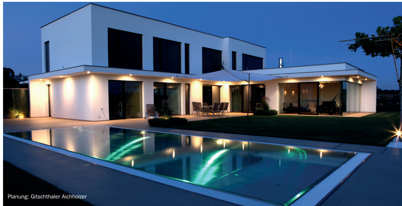
Planung: Gitschthaler Aichholzer