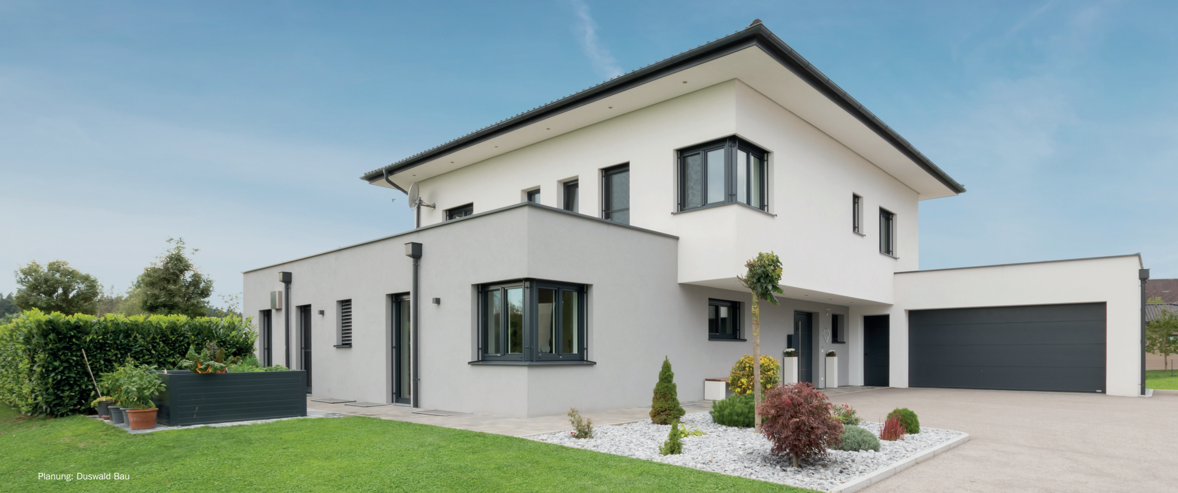
Planung: Duswald Bau