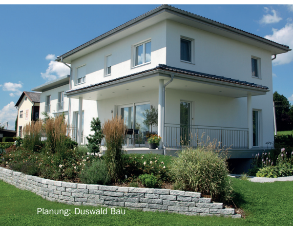
Planung: Duswald Bau