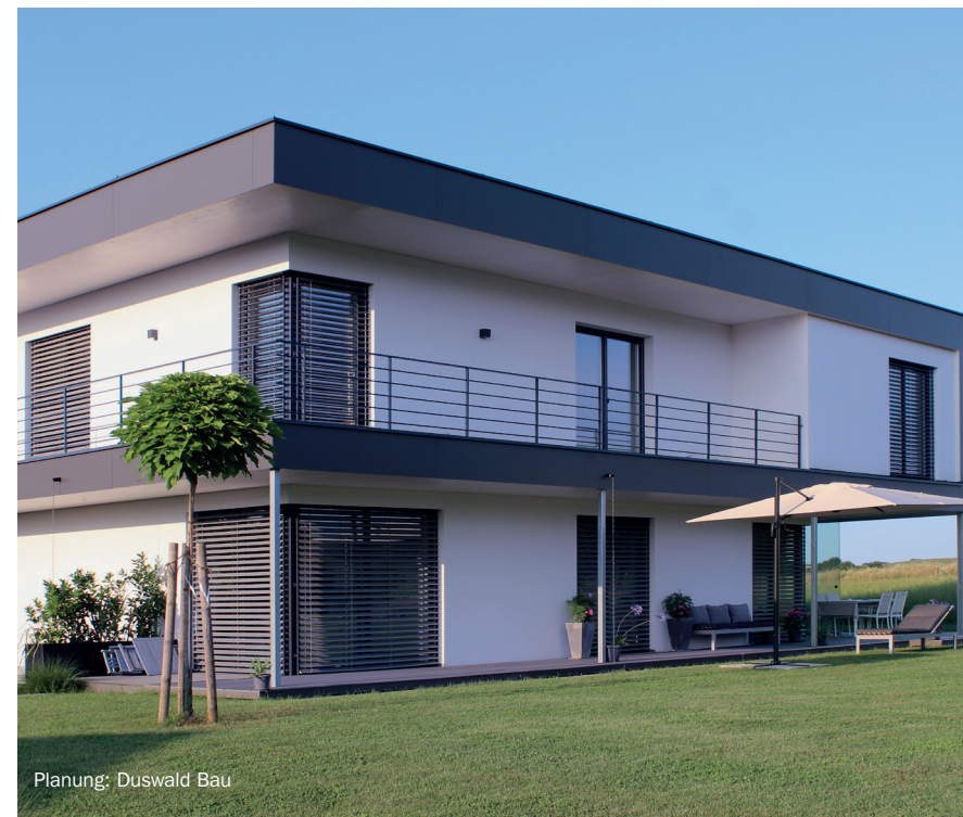
Planung: Duswald Bau