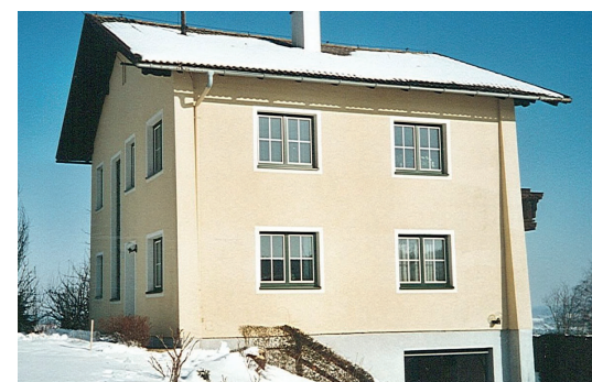
Es gilt, die Ausstrahlung und den Wert der bestehenden Bausubstanz zu erkennen und zu erhalten und gleichzeitig an die modernen Anforderungen anzupassen.