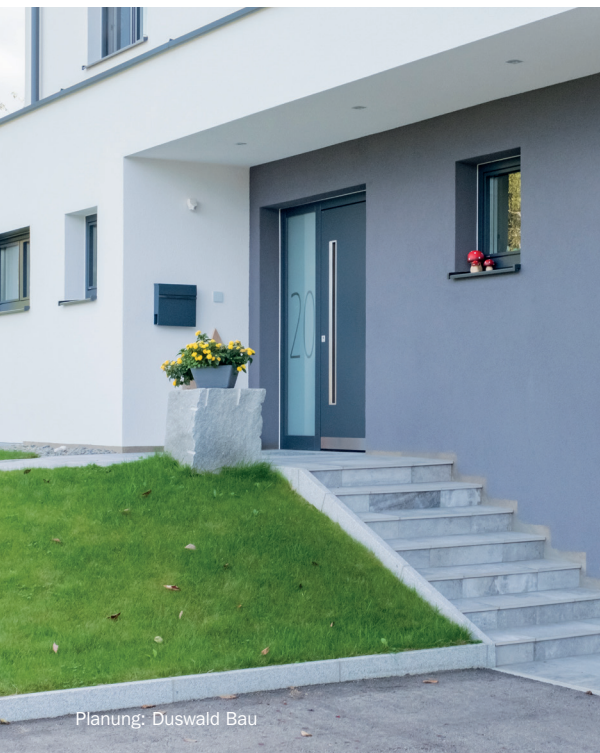
Planung: Duswald Bau