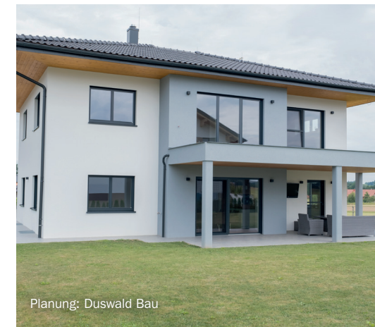
Planung: Duswald Bau