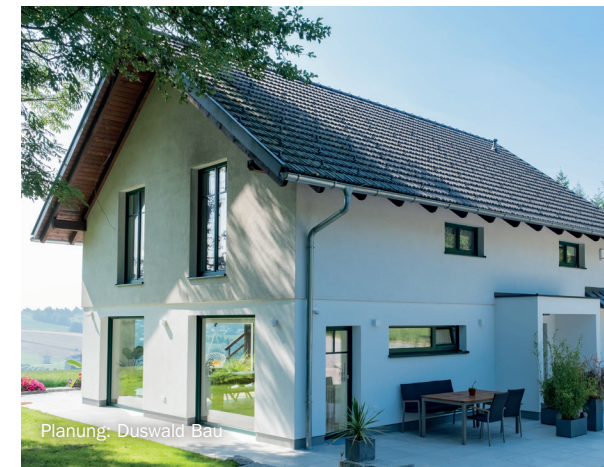
Planung: Duswald Bau