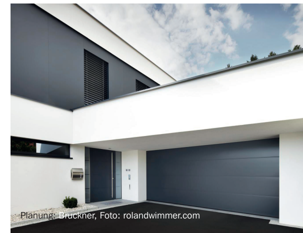
Planung: Brückner