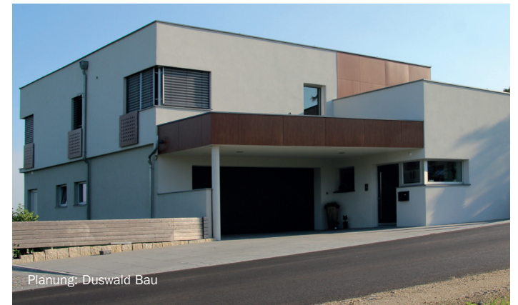
Planung: Duswald Bau