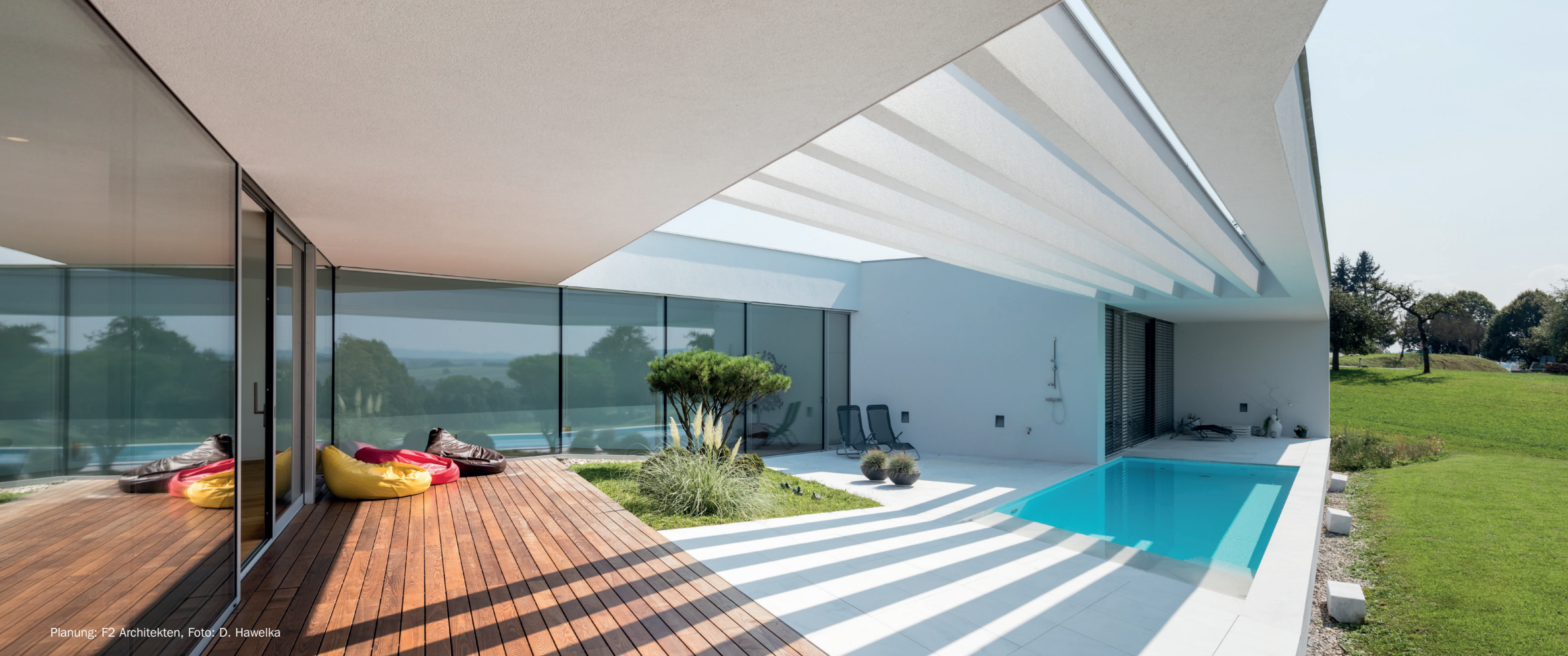
Planung: F2 Architekten, Foto: D. Hawelka