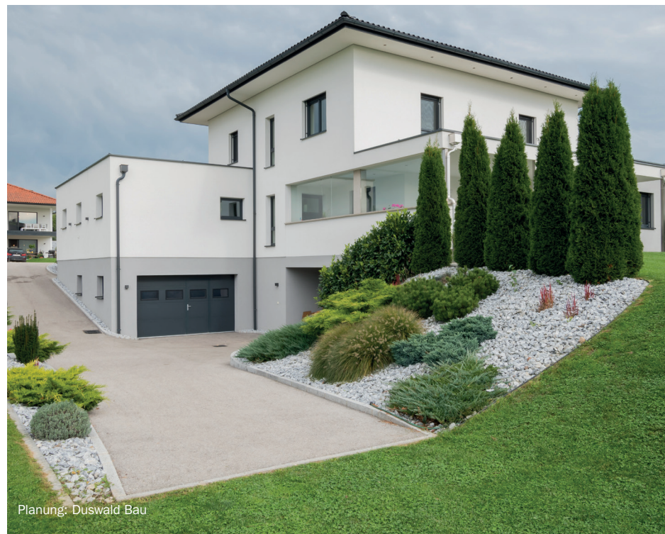
Planung: Duswald Bau