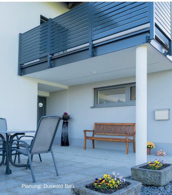
Planung: Duswald Bau