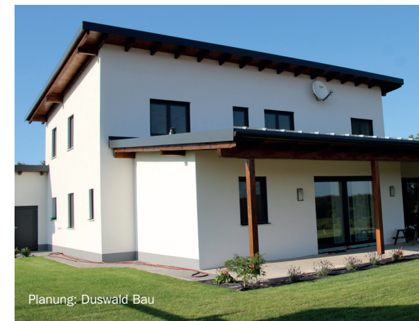
Planung: Duswald Bau