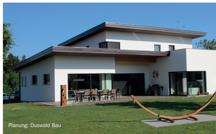
Planung: Duswald Bau