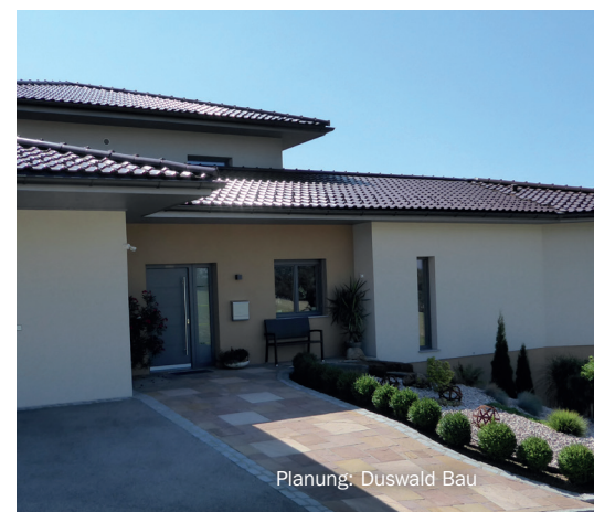
Planung: Duswald Bau