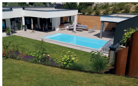
Umfangreiche Umgestaltung des Grundstücks Aushub, Schalungsarbeiten, optimale Nutzung auch von kleinen Grundstücken oder Hanglage