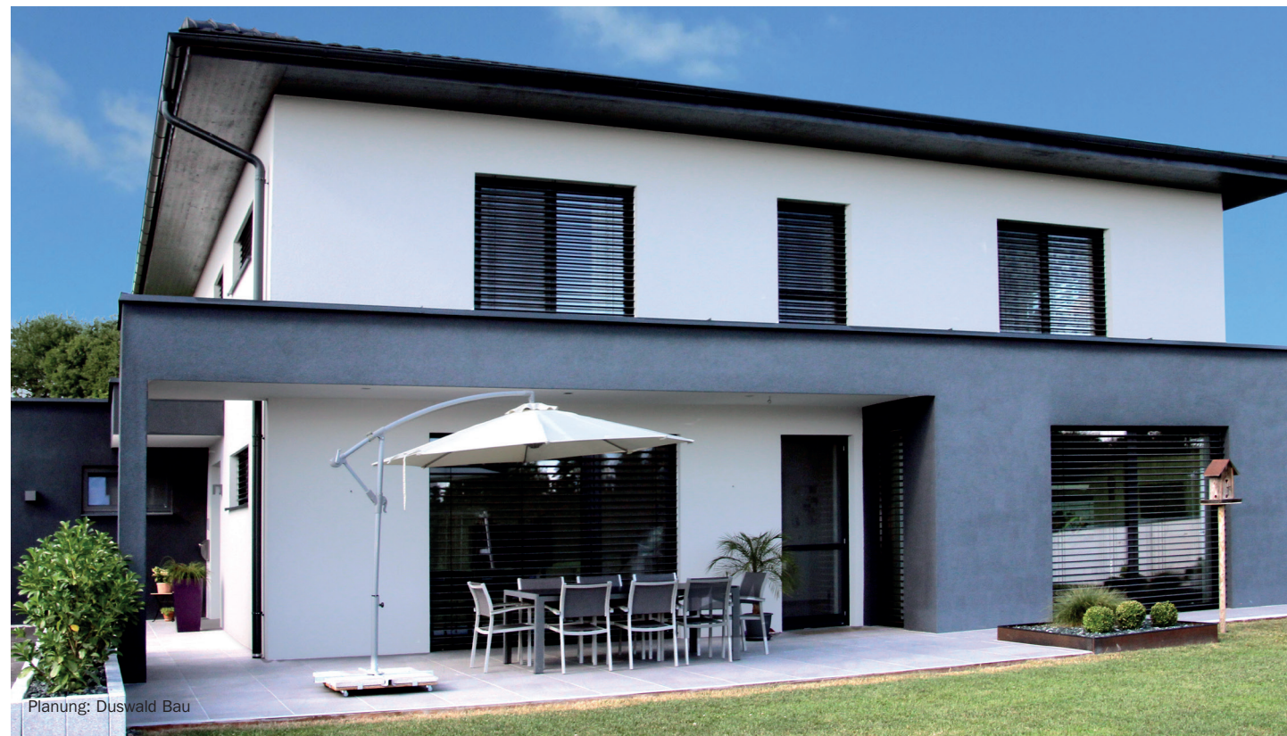
Planung: Duswald Bau

Privater Wohnbau, Massivbau Planung und Umsetzung in kurzer Zeit; Zweigeschoßig inkl. Doppelgarage und großzügiger Terrassenüberdachung; 50 MWK