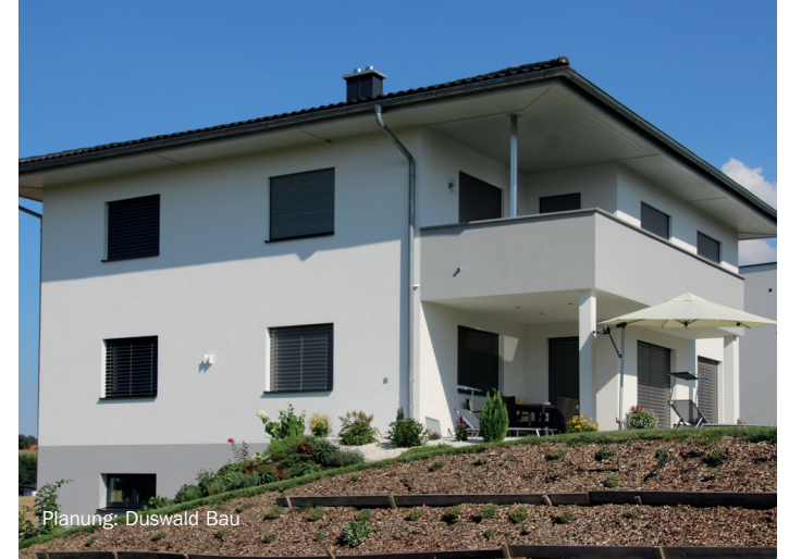
Planung: Duswald Bau